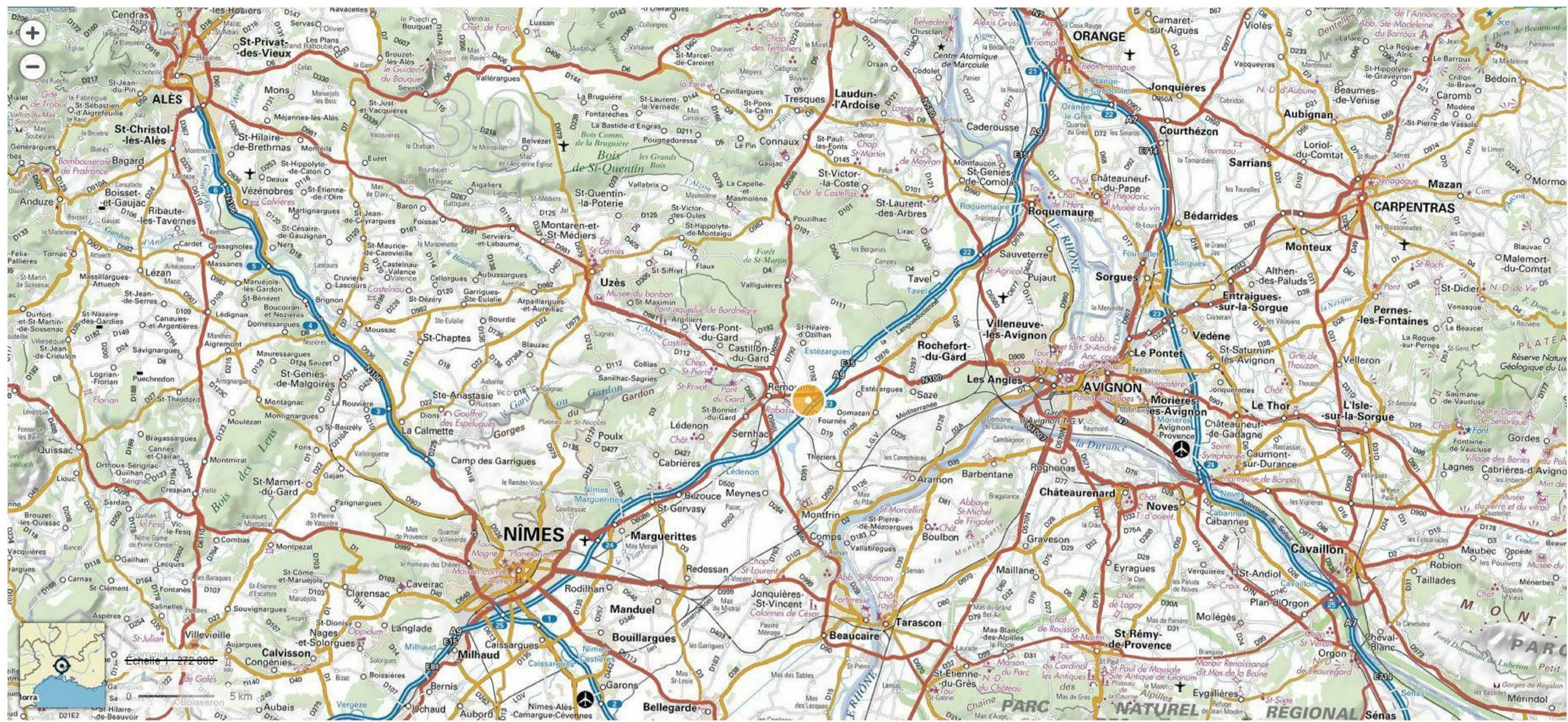
PLAN DE SITUATION ELARGI